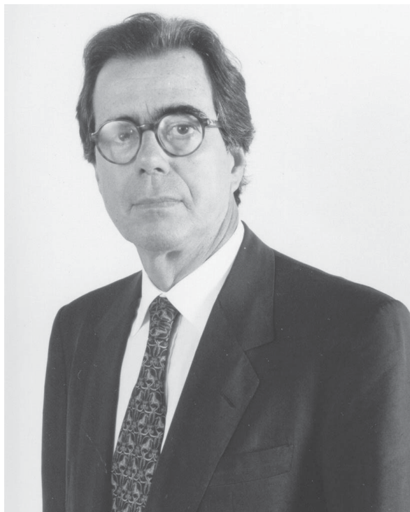
Professor Carlos Geraldo Langoni